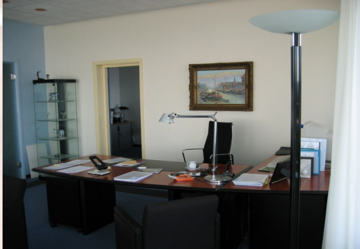
Eilanden en koninkrijken