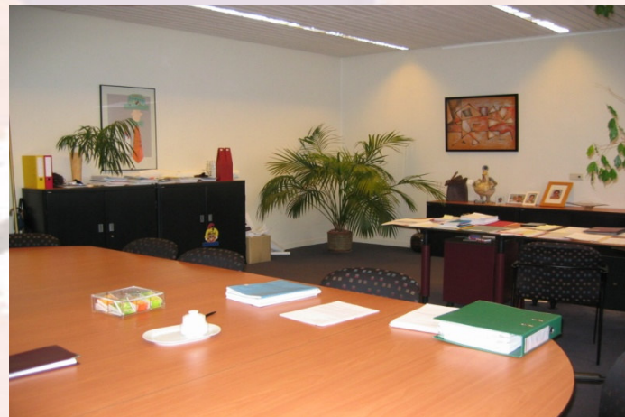
Vloerbedekking en verzakelijking