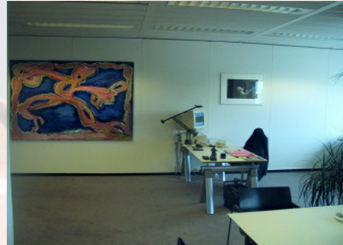
Groot en wijdverspreid